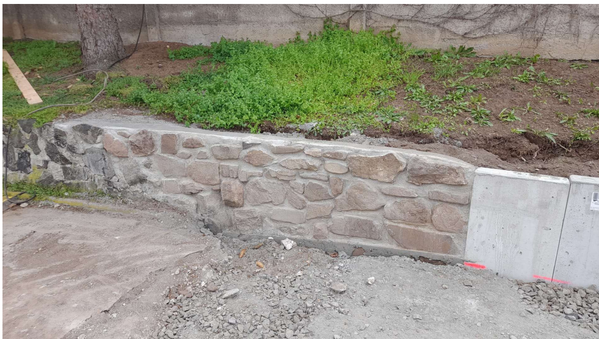
Opěrná zeď z L prefa prvků na vjezdové komunikaci do areálu