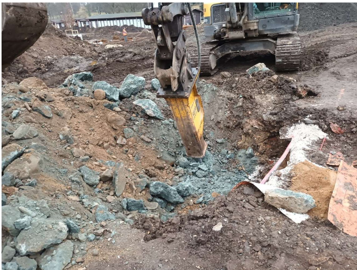
Bourání betonu a základů z cihel u VŠ 1