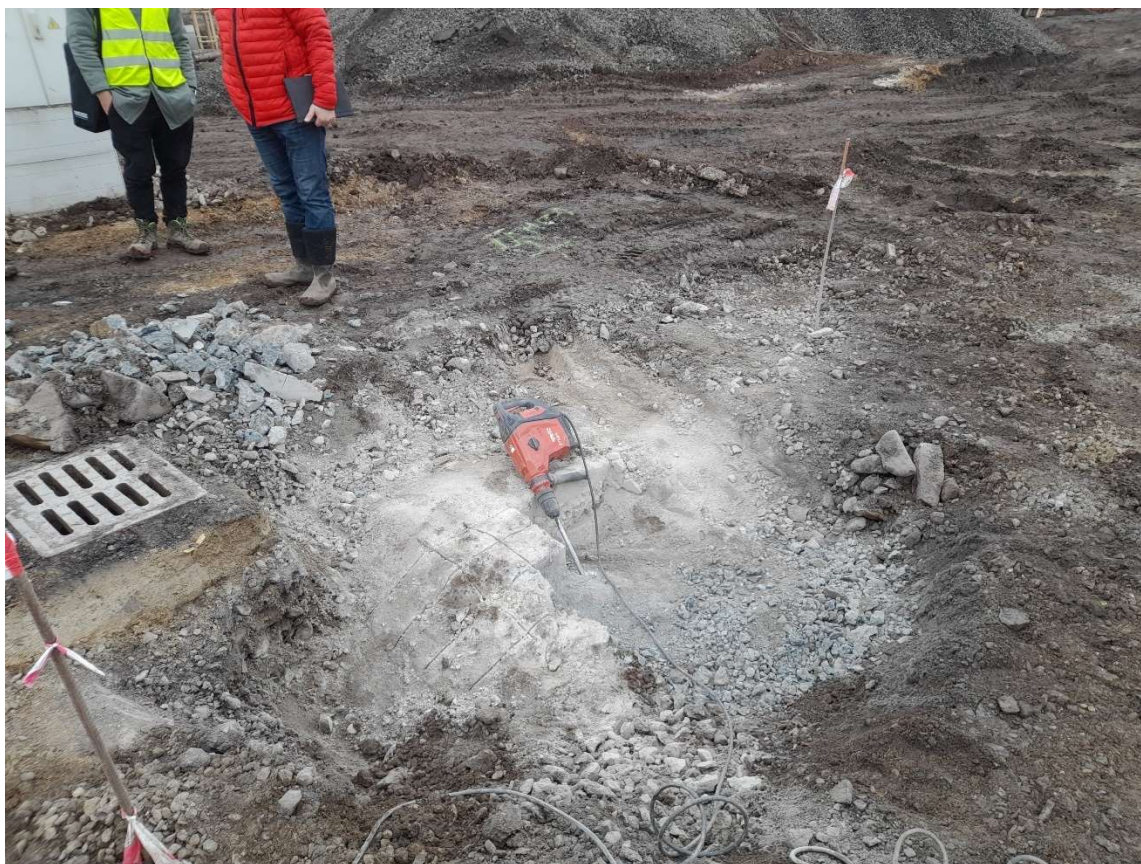
Bourání betonu u UV v Přemyslově ulici