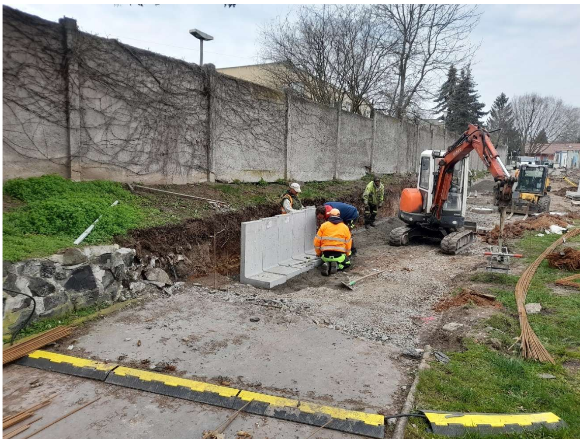
Bourání betonu propojka pod infocentrem